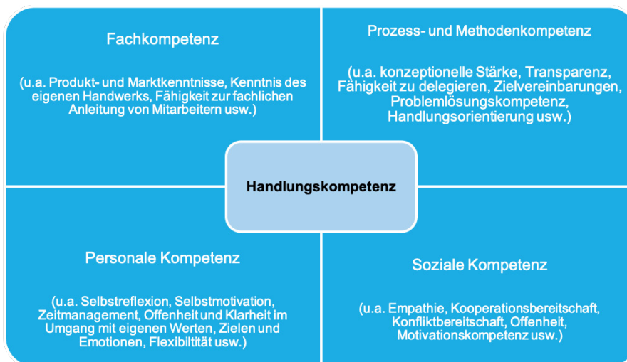
Abbildung: Kompetenzen der Führung, eigene Darstellung

Das Führen von Mitarbeitern, Teamkollegen oder anderen Kollegen ist eine komplexe Aufgabe, die Kompetenzen, Fähigkeiten und Fertigkeiten auf unterschiedlichen Ebenen voraussetzt. Führungskräfte sollten neben fachlichen Kompetenzen auch methodische Kompetenzen sowie soziale und personale Kompetenzen für die Führung mitbringen – oder sukzessive entwickeln.